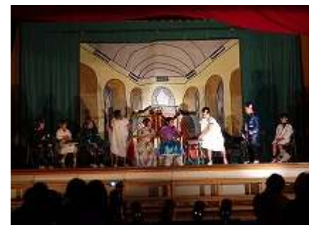
3・4年生 劇『ほんとうの宝ものは～関岡で見つけた宝もの～』