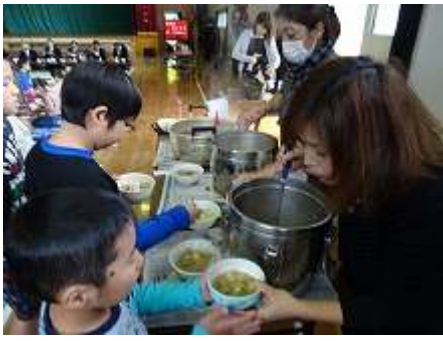
アツアツの豚汁いただきます