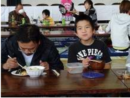
親子で仲良く食べました