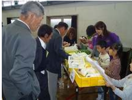
1・2年生の野菜販売