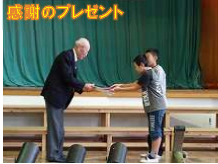
感謝のプレゼント