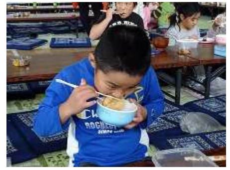
一心不乱に食べています