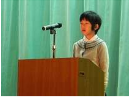
『水泳で学んだこと』