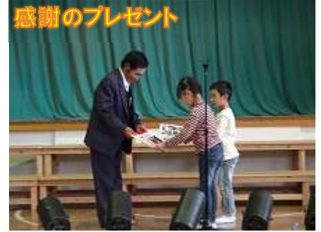
感謝のプレゼント