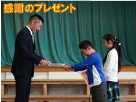
感謝のプレゼント