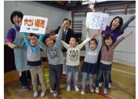
完売で〜す やったあ