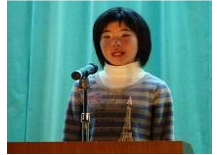
『最後の卒業生として』