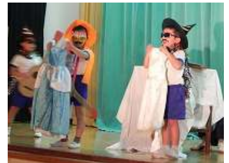
1・2年生 開幕劇『はじめのことば』