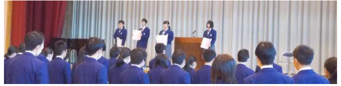
《今週の全校集会での全校表彰》