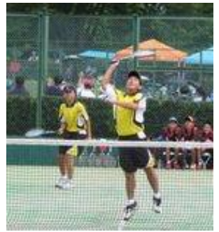
《県中学校総合体育大会》