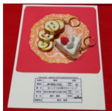
《お菓子のストラップ》