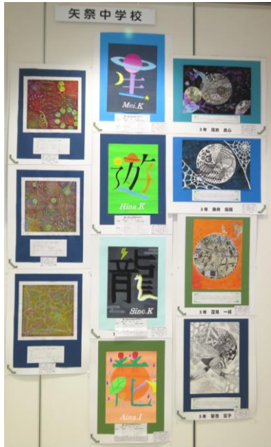
《版画・文字デザイン・空想の星》