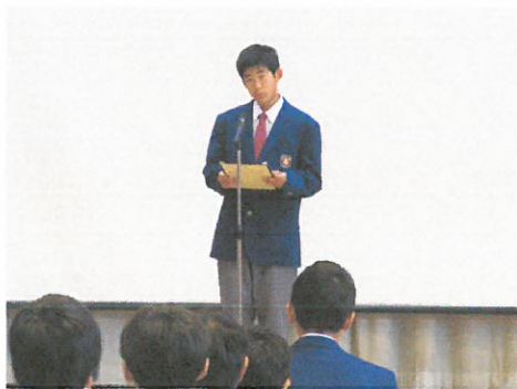
生徒発表のようす

また、全校朝会で私から「情報モラル」について話をしました。インターネットの使い方や危険性などについて確認しました。中学生がラインのトラブルにあうことが多いのでご家庭で使用時間や内容について確認をして使用について指導をお願いします。