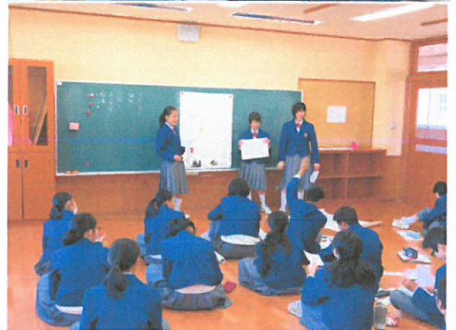
総合発表の練習のようす