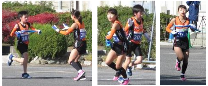
《郡山北工業高校中継所》

17日(日)に第31回ふくしま駅伝が開催され、矢祭町チームは総合40位、町の部18位と過去4年間の成績を上回る健闘を見せてくれました。