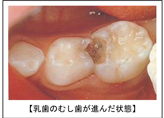
【乳歯のむし歯が進んだ状態】