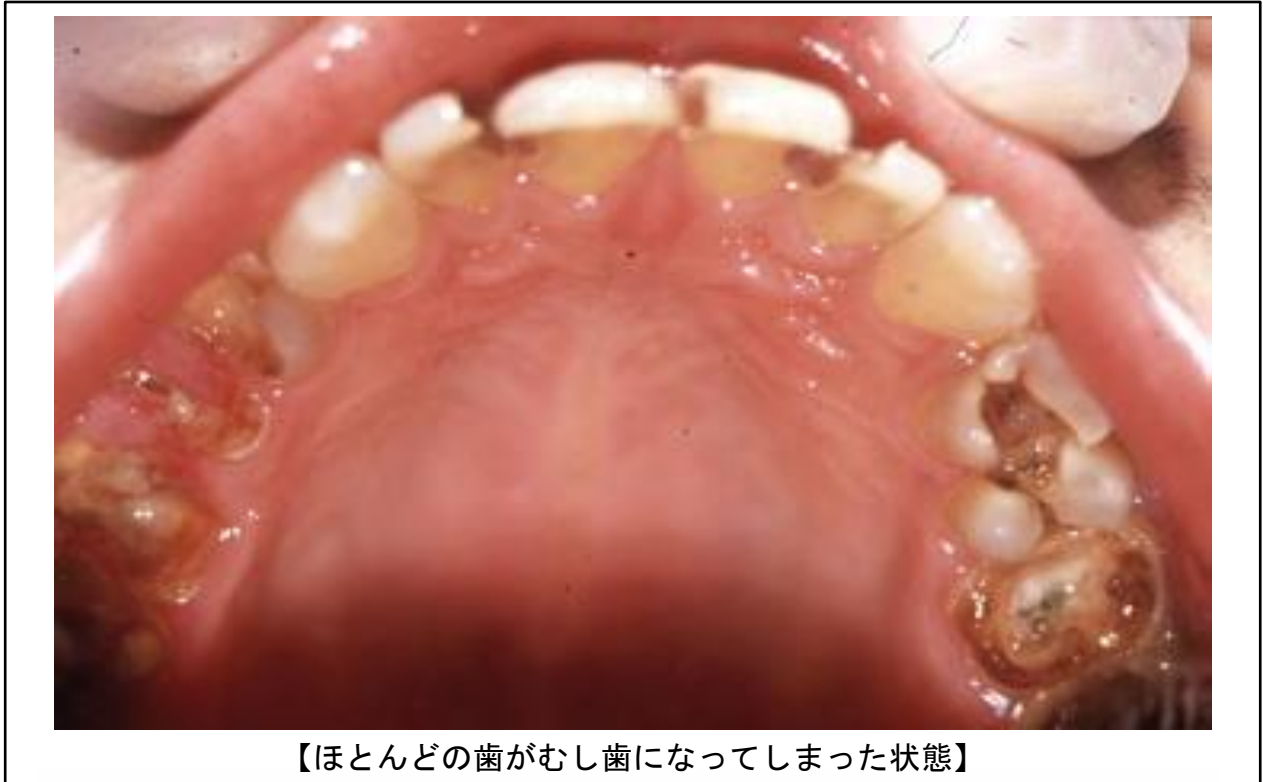
【ほとんどの歯がむし歯になってしまった状態】