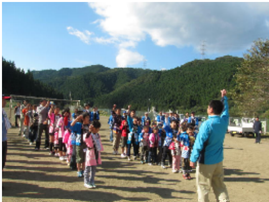
【10月13日：子ども神輿祭り】

今年は、晴天にも恵まれ、盛大に行うことができました。地域の行事に参画することで地域のよさや伝統文化について考えることができました。(豊かな心の育成)