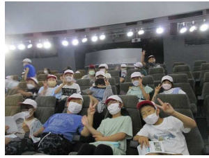
【4年プラネタリウム】